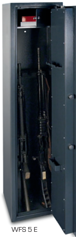
WFS 5 E

Der hohe Waffenschrank zum günstigen Preis