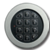
Elektronischschloss Modell ECO-Basic 35 mm vorstehend