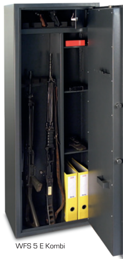
WFS 5 E Kombi