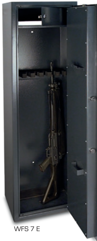
WFS 7 E